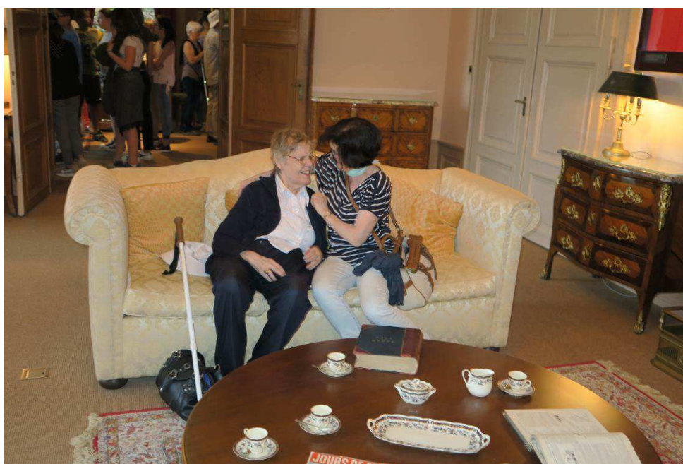
Une bénévole décrit une pièce du musée Charlie Chaplin à une cliente sourdaveugle.

Sans l'aide des collaborateurs et des collaboratrices bénévoles, nombre de prestations essentielles à la qualité de vie des personnes sourdaveugles ne pourraient être assurées.